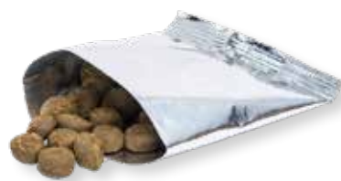
BOULETTES POUR CHATS