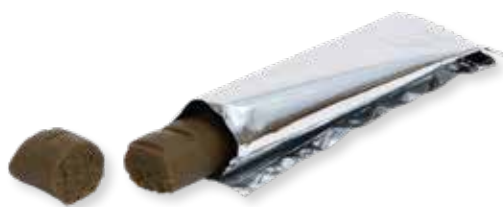
BARRES POUR CHIENS

"Easypill® Smectite réduit le risque de malabsorption aiguë."