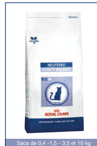
Sacs de 0,4 -1,5 - 3,5 et 10 kg

****L.I.P. (Low Indigestible Protein) : Protéine sélectionnée pour sa très haute assimilation